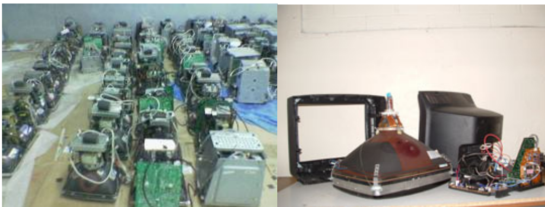
Desmontaje de los televisores y vista del detalle de sus componentes: TRC, plaquetas, carcasas plásticas y cables. 20

Los TRC contienen un porcentaje de plomo, aunque las versiones más modernas han reducido su contenido del fondo de la pantalla. El proceso de recuperación de materiales consiste en, una vez desmontados la carcasa, las estructuras plásticas, metálicas y cables, el tubo debe destruirse en condiciones especiales para separar sus componentes. Los distintos tipos de vidrio se separan para enviar a industrias de vidrio no relacionadas con el consumo de alimentos y bebidas. Así, se recuperan los plásticos, vidrio, cobre, acero, cables, plaquetas.